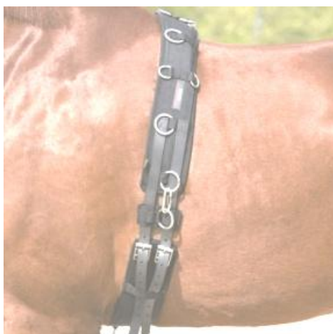
подпруга (широкий ремень седла, который затягивается под брюхом лошади)