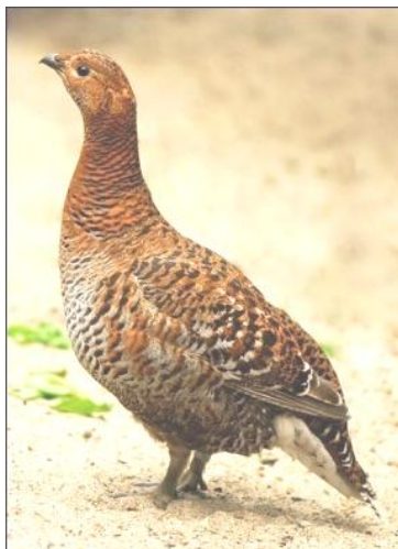
тетерка (крупная дикая птица)